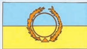
Bandera del Milenio de Paz