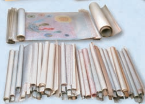
Los Rollos del Cordero de Dios (Apocalipsis 5)