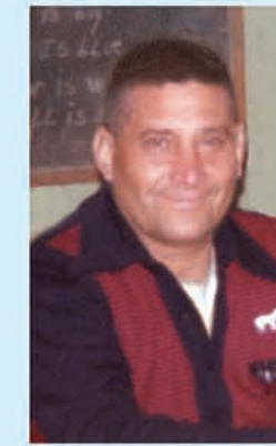
Alfa y Omega, Enviado del Divino Padre Eterno, Autor de la Ciencia Celeste.-