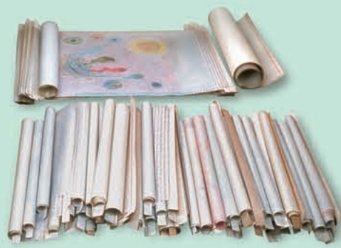
Los Rollos del Cordero de Dios (Apocalipsis 5)