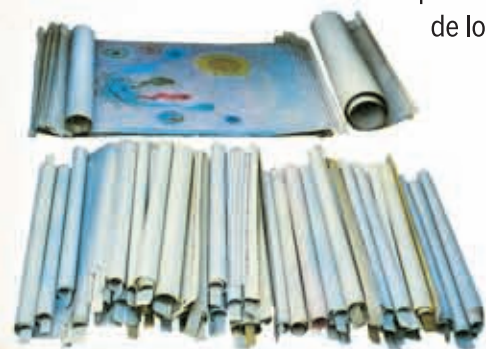
Los Rollos del Cordero de Dios (Apocalipsis 5)