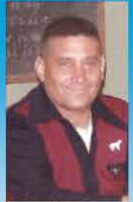
Alfa y Omega Enviado del Divino Padre Eterno, Autor de la Ciencia Celeste.-