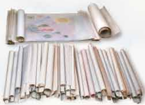
Los Rollos del Cordero de Dios (Apocalipsis 5)