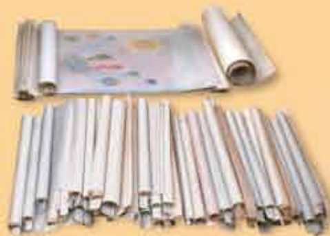
Los Rollos del Cordero de Dios (Apocalipsis 5)