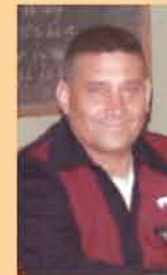
Alfa y Omega Enviado del Divino Padre Eterno, Autor de la Ciencia Celeste.-