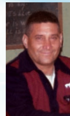
Alfa y Omega, Enviado del Divino Padre Eterno, Autor de la Ciencia Celeste.-

Ninguna ley humana ó ciencia terrestre, podrá jamás explicar su propio origen; tiene que ser un Enviado del divino Padre; con una nueva Doctrina; salida del universo viviente; pues toda Doctrina posee también un libre albedrío; es por eso que por su fruto se conoce, del árbol que proviene; toda Doctrina del Padre, transforma los mundos; pues todas las demás, están subordinadas, a la Santísima Trinidad, en la Trinidad; toda Doctrina que no es del Padre, probada es; y no tiene el divino sello de la eternidad; puesto que pasa al olvido, tarde ó temprano; la divina Doctrina de la Ciencia Celeste, es eterna; está llamada a iniciar el Milenio de Paz, conque nace el nuevo mundo; un mundo tan fascinante, como justo; en que la filosofía de los niños, reinará por toda eternidad; con ello triunfa el divino pensar, de un divino Corderito; venido del Reino de los Cielos.-