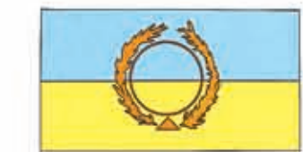
Bandera del Milenio de Paz