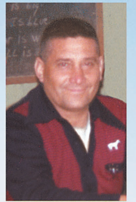
Alfa y Omega, Enviado del Divino Padre Eterno, Autor de la Ciencia Celeste.-

Revela el Divino Creador: La vida humana fué creada; no se creó ella misma; aunque es herencia del divino Padre; la criatura humana y todas las formas de vida, no presenciaron sus propios nacimientos; porque el principio de la vida es un sueño que se vá reconociendo a medida que aumenta su actividad; el estado de inocencia espiritual, es el sueño solar; la Madre Solar Omega contiene en sus divinas entrañas, el principio eterno de nuevas filosofías planetarias; el fuego solar es el creador único de toda materia y todo espíritu; ambos salen de un mismo punto; es una sola la causa; como uno sólo es el Creador; uno con diversificación infinita.-