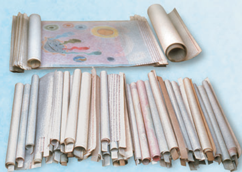
Los Rollos del Cordero de Dios (Apocalipsis 5)